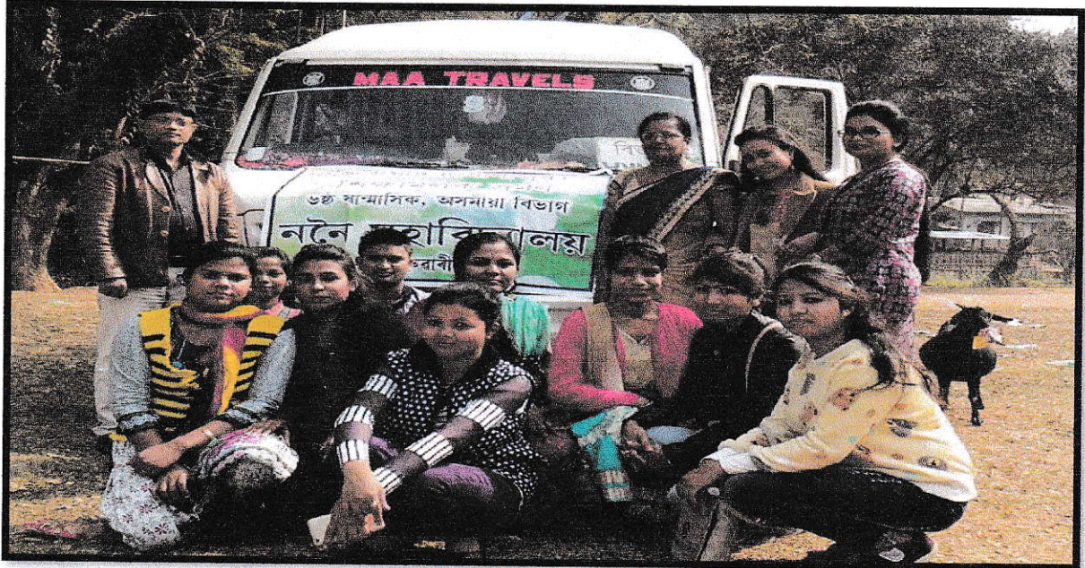
Students & Teachers in Educational Tour